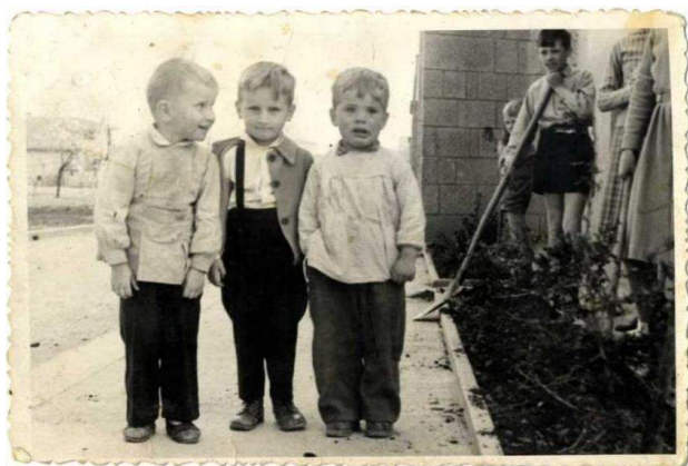
Otroci pred Ruskimi bloki (last: Iztok Čeperli)

(v primeru slabega vremena se dogodek preseli v Xcenter, Delpinova 20, Nova Gorica)